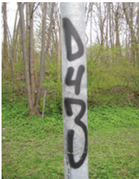
Figur 3. Vestvolden, Rødovre