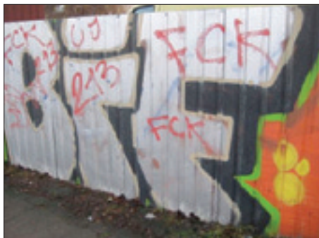
Figur 1. Jyllingevej, Rødovre, 29. november 2015

Vores byområder indeholder mange skrevne koder i form af graffiti , typisk på mure, skilte og andet by-inventar. Kender man ikke koderne, forstår man ikke indholdet og opfatter dem ofte blot som en irriterende øjebæ.