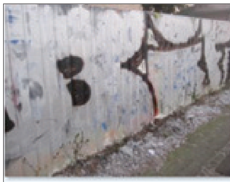
Figur 2. Jyllingevej, Rødovre, 8. januar 2018

Hvis man betragter en graffiti som indledningen til en potentiel samtale, kan tilføjelserne betragtes som en replik. I januar 2018 kunne jeg konstatere, at »replikken« vedr. FCK var blevet malet over, og bogstaverne B I F modificeret (figur 2). Funktionen går således fra monolog til dialog – og (foreløbig) tilbage til monolog .