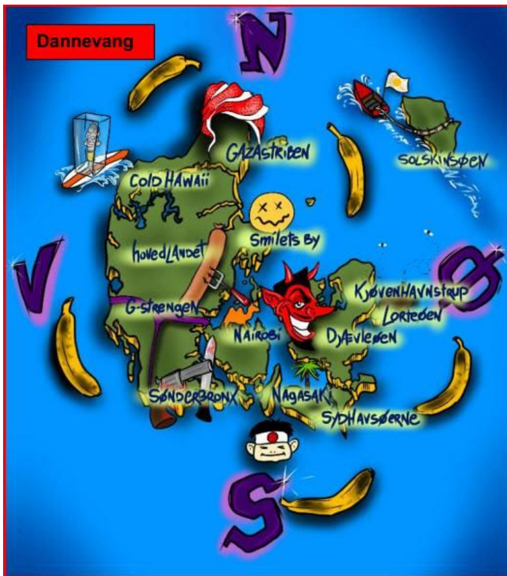
Tegning: David Dinon.